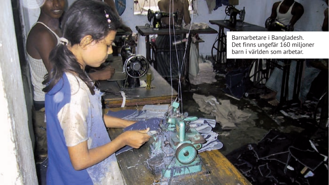
Barnarbetare i Bangladesh. Det finns ungefär 160 miljoner barn i världen som arbetar.