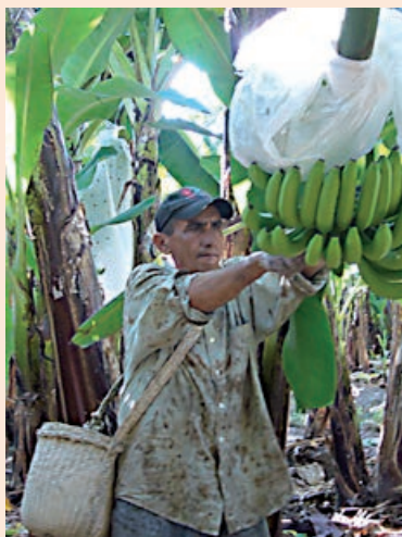
Skörd och hantering av rättvisemärkta bananer.