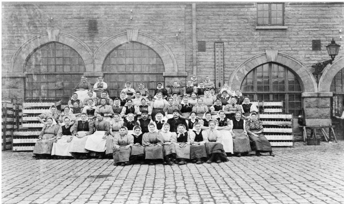
Arbetare på Münchenbryggeriet ca 1900–1910.