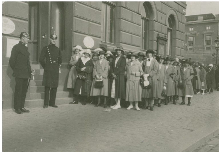
Strejkande telefonister 1922.