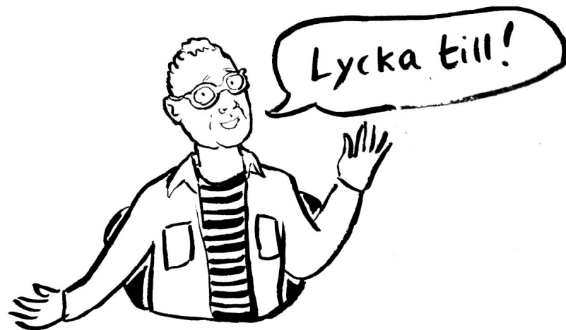
Illustration av Sofia Lucas ur materialet A– Ö om arbetslivet