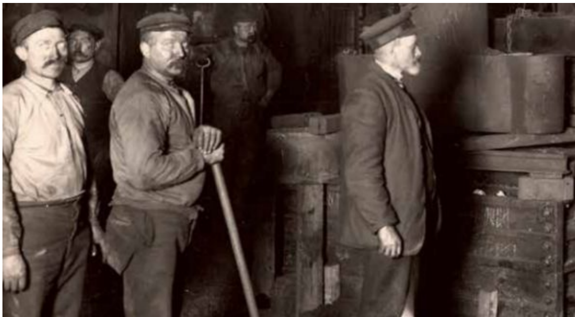
Gjuteriet på J och C G Bolinders mekaniska verkstad 1910.