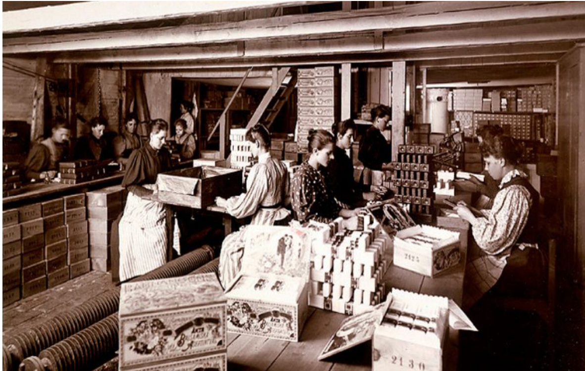
Arbetare på Barnängens tekniska fabriker på Södermalm 1894.