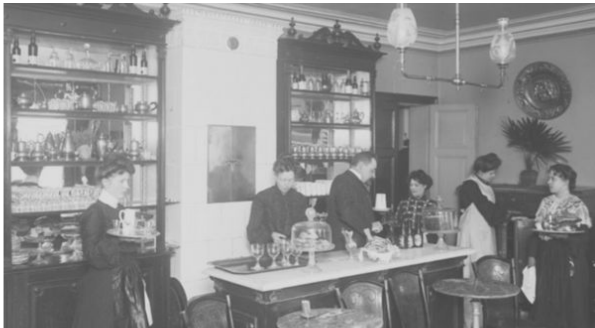
Café i Stockholm 1910.