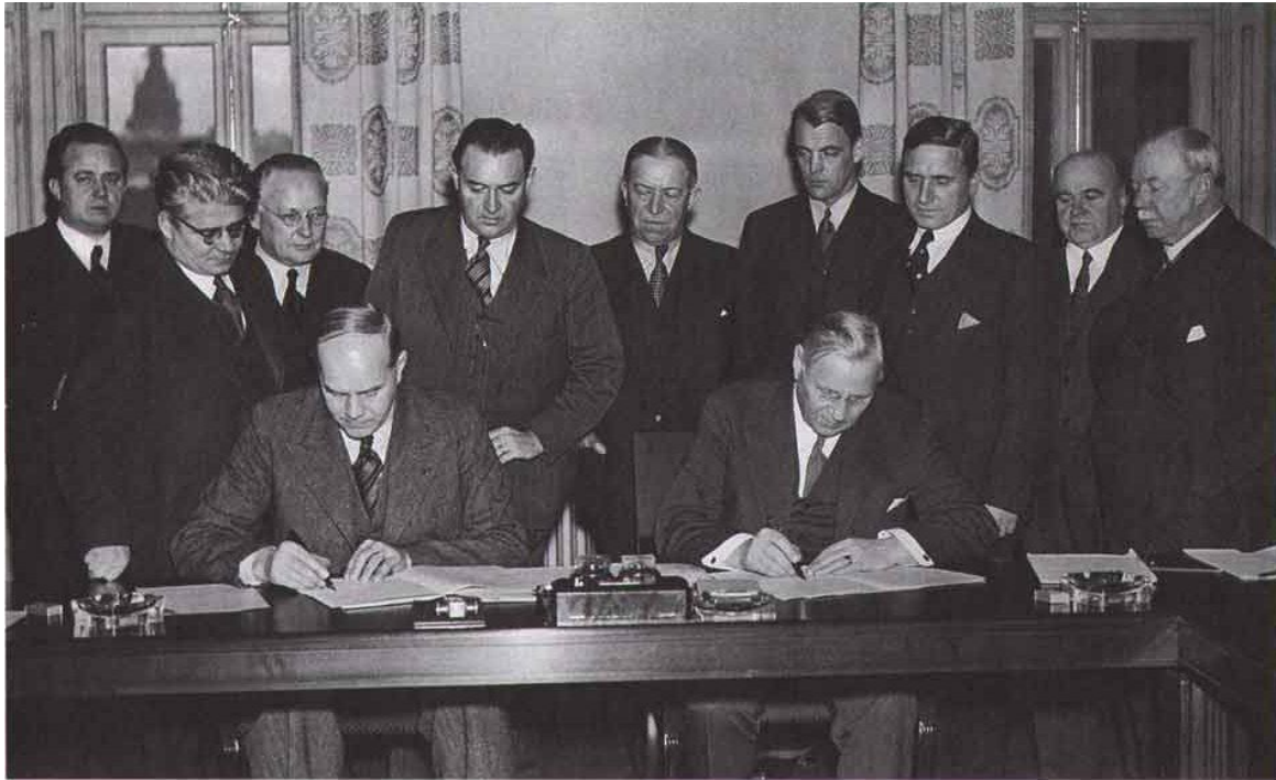
Saltsjöbadsavtalet undertecknas av representanter från LO och SAF 1938.