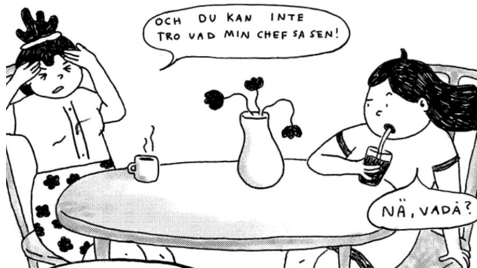
Illustration av Julia Balke och Sofia Lucas. Ur materialet En serie om arbetsmiljö .