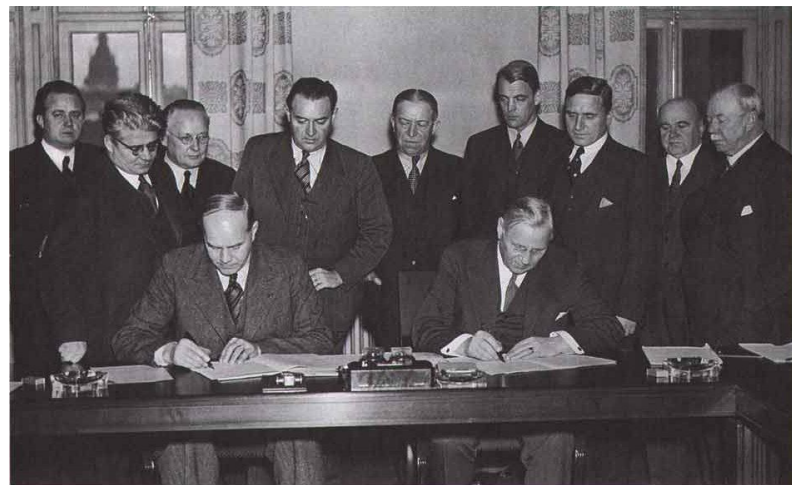
Saltsjöbadsavtalet undertecknas av representanter från LO och SAF 1938.

1938 slöts Saltsjöbadsavtalet mellan arbetsgivare och fackföreningar vilket ledde till en lång period av arbetsfred och samarbete. Det var starten för den svenska modellen där fack och arbetsgivare gör upp om reglerna på arbetsmarknaden.