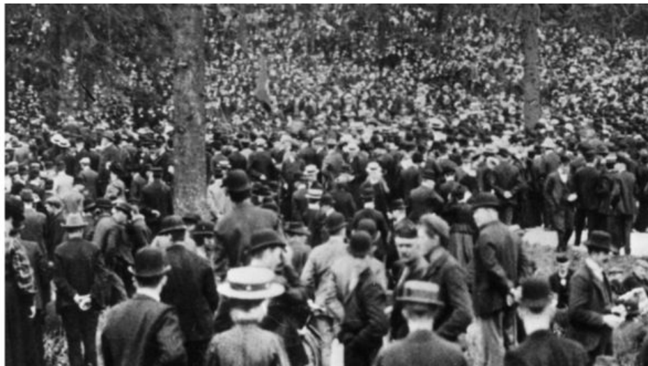
Strejkande i Lill-Jansskogen under storstrejken 1909.

I början av 1900-talet skedde flera stora konflikter på arbetsmarknaden. Arbetarna strejkade och arbetsgivarna svarade med att stänga ute de strejkande från arbetsplatserna.