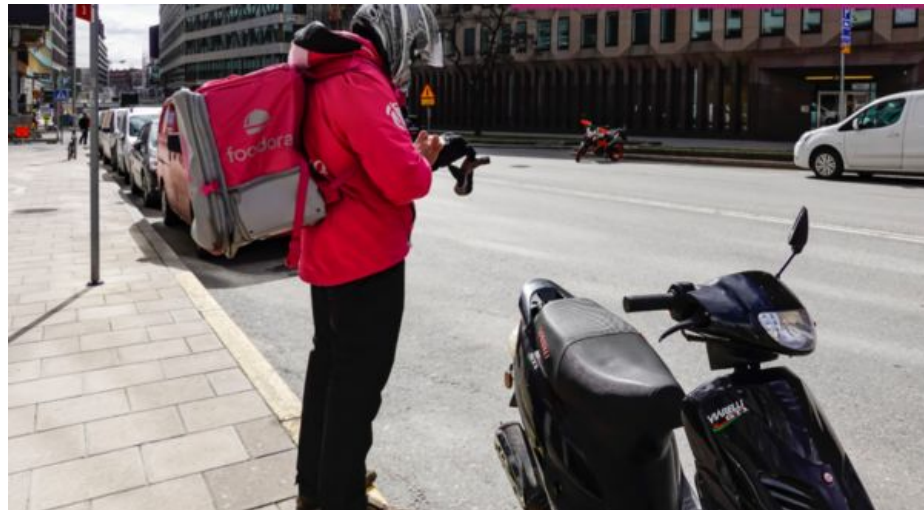
Foodorabud i Stockholm 2021.

Som gigjobbare jobbar du på kortare uppdrag och anställningsformerna kan se väldigt olika ut. 2021 skrev Svenska Transportarbetareförbundet ett kollektivavtal med Foodora, vilket var det första i världen, men det gäller dock inte alla som arbetar i företaget.