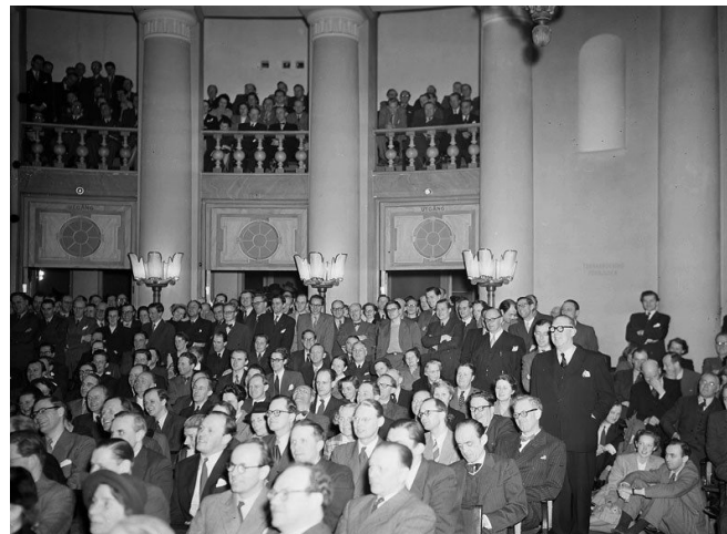
Sacos informationsmöte på Handelshögskolan 1952.

På 30- talet började även tjänstemännen att organisera sig fackligt och fler och fler tjänstemän fick kollektivavtal. En viktig fråga var pensioner. Tjänstemännens fackliga arbete var partipolitiskt obundet. 1944 bildas TCO och 1947 Saco. Dessa centralorganisationer för tjänstemän finns än idag och organiserar yrkesgrupper som till exempel socionomer, lärare, och ingenjörer. Offentliganställda fick rätt att strejka och teckna kollektivavtal först 1966 vilket är långt senare än andra yrkesgrupper.