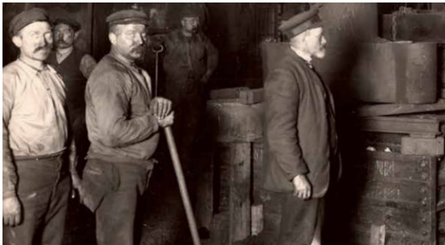
Gjuteriet på J och C G Bolinders mekaniska verkstad 1910.