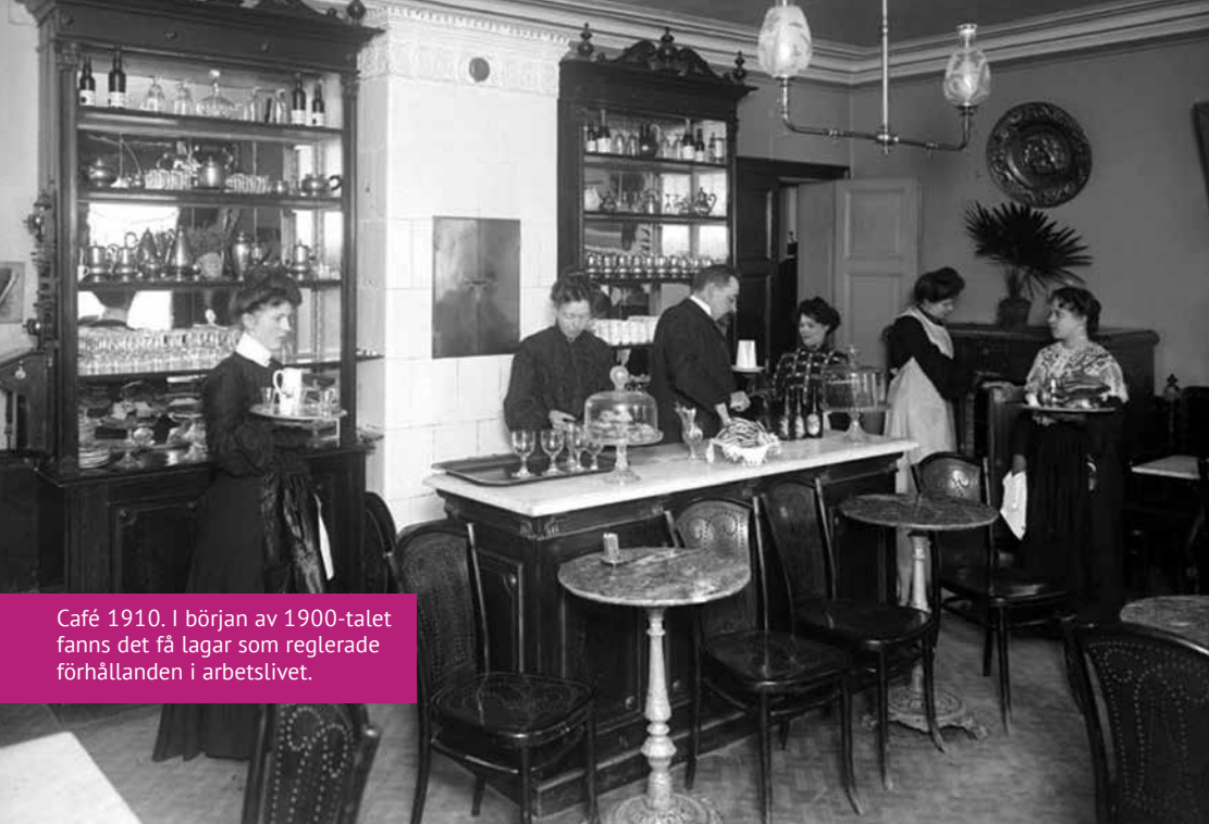
Café 1910. I början av 1900-talet fanns det få lagar som reglerade förhållandena i arbetslivet.