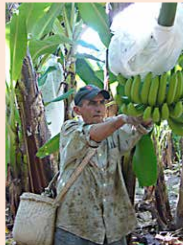
Skörd och hantering av rättvisemärkta bananer.