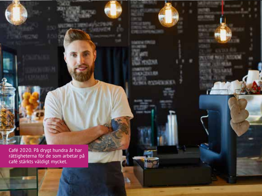
Café 2020. På drygt hundra år har rättigheterna för de som arbetar på café stärkts väldigt mycket.