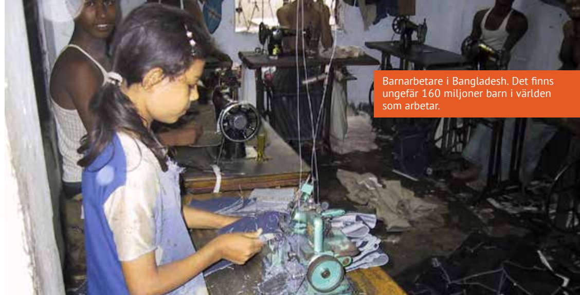
Barnarbetare i Bangladesh. Det finns ungefär 160 miljoner barn i världen som arbetar.

Länder i världen som är kända för bristande demokrati och omfattande kränkningar av mänskliga rättigheter i arbetslivet är bland annat Kina, Guatemala och Förenade Arabemiraten. Andra länder som märker ut sig är Thailand, Turkiet, Indien och Kambodja, vilka är länder som svenskar gärna semestrar i och där flera svenska företag lägger ut sin verksamhet. Kränkningar av mänskliga rättigheter i arbetslivet har ökat och arbetstagare och fackligt aktiva drabbas i hela världen. Fackliga organisationer och organiserade arbetstagare blir också måltavlor eftersom de ofta driver på för demokratiska reformer.