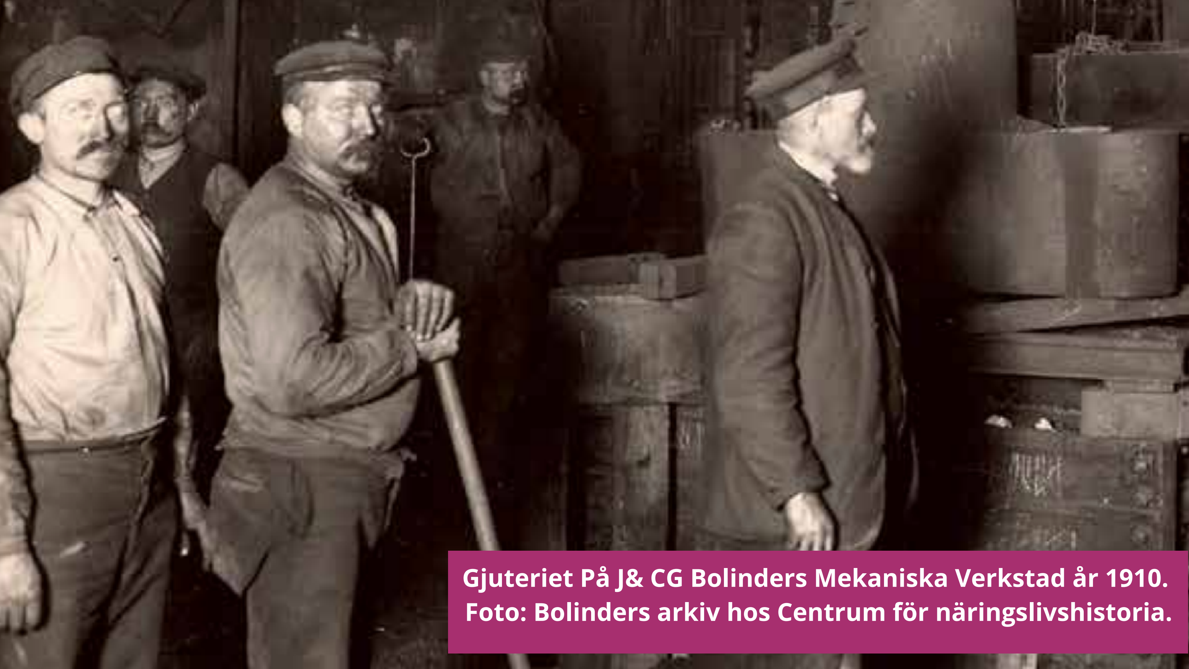
Gjuteriet På J& CG Bolinders Mekaniska Verkstad år 1910.