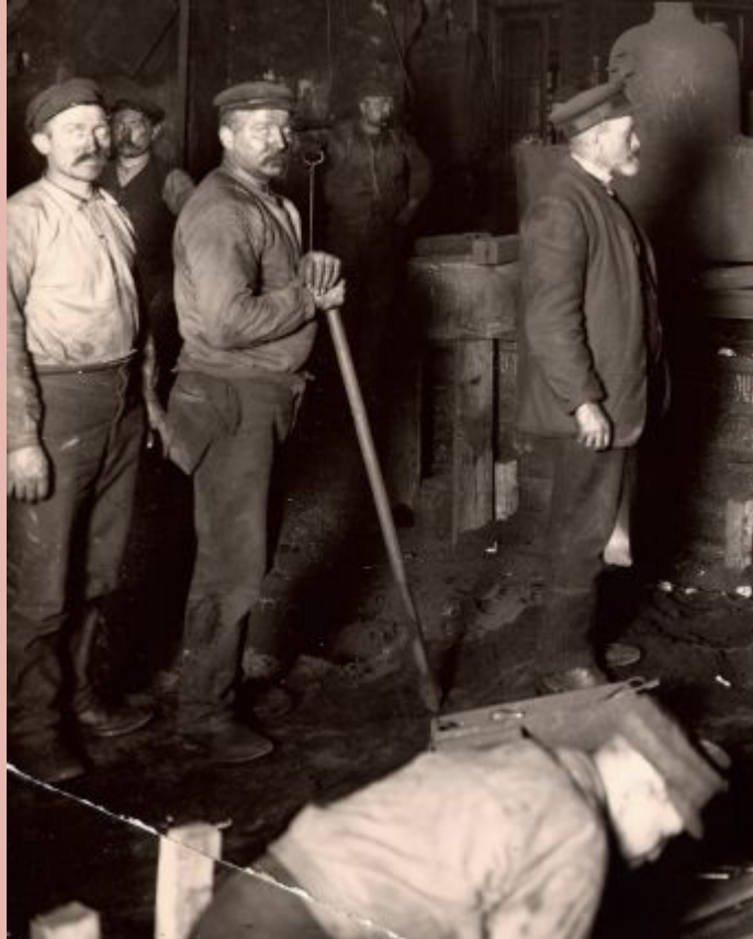
Gjuteriet På J& CG Bolinders Mekaniska Verkstad år 1910.