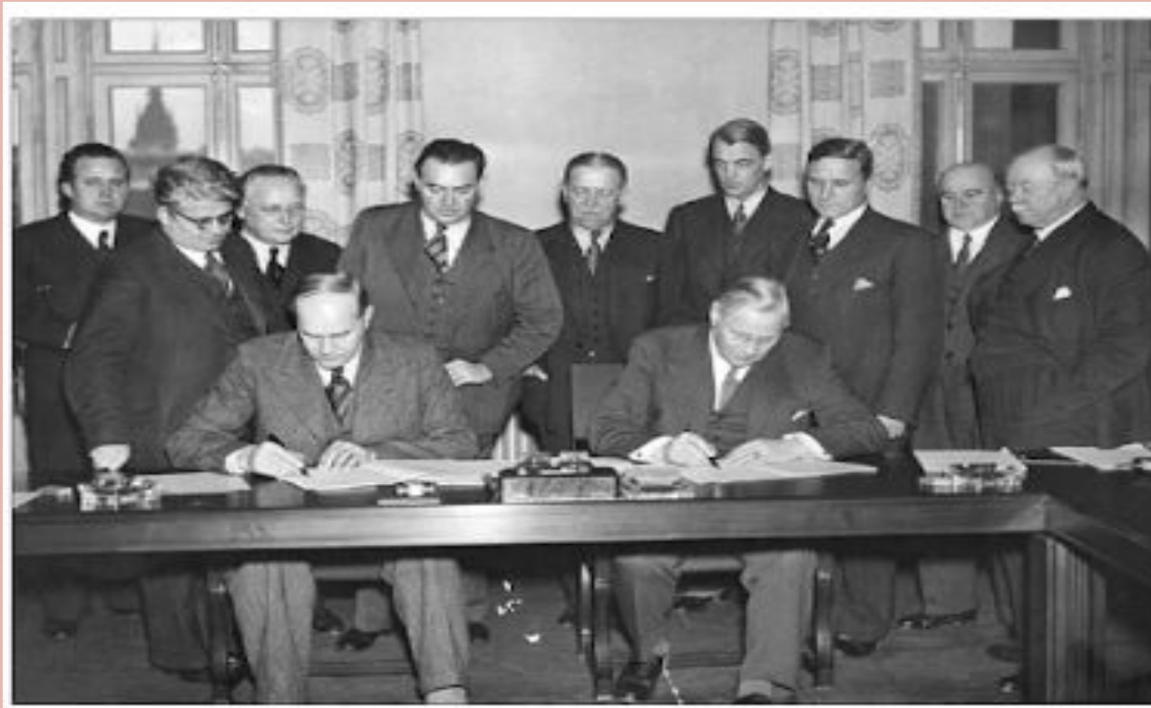
Saltsjöbadsavtalet undertecknas av representanter för fack och arbetsgivare.