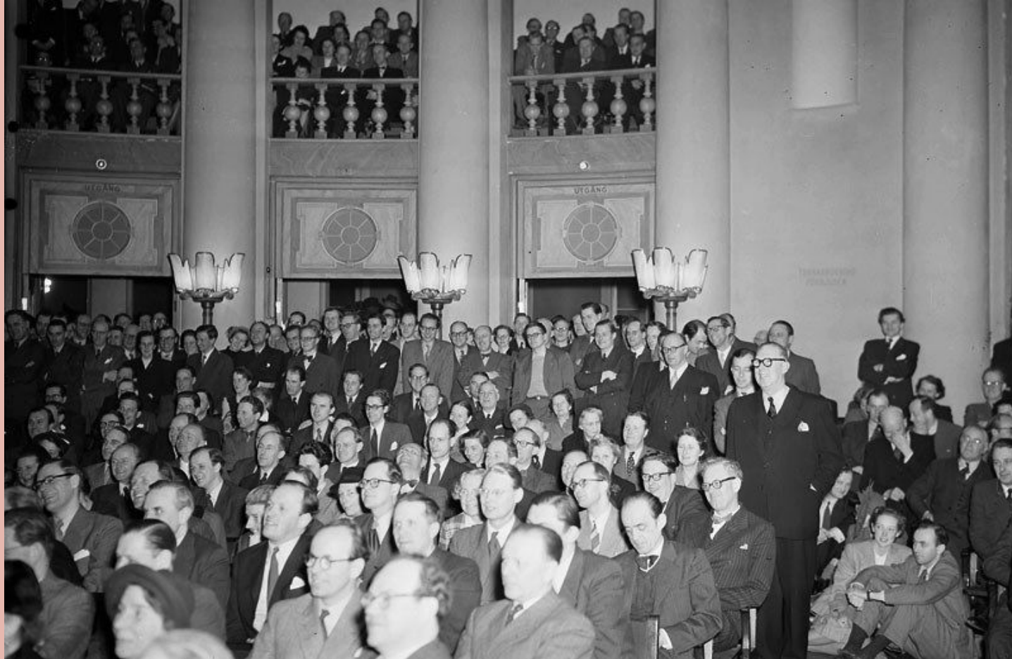
Sacos informationsmöte på Handelshögskolan 1952.